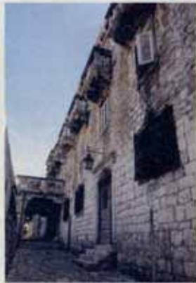
PALAČA VUKAŠINOVIĆ u Hvaru, predviđena za postdiplomski studij EPH-ovog sveučilišta

Upisano 16 studenata, a uz djelomičnu potporu upisano je još 25 studenata koji plaćaju 5500 kuna godišnje