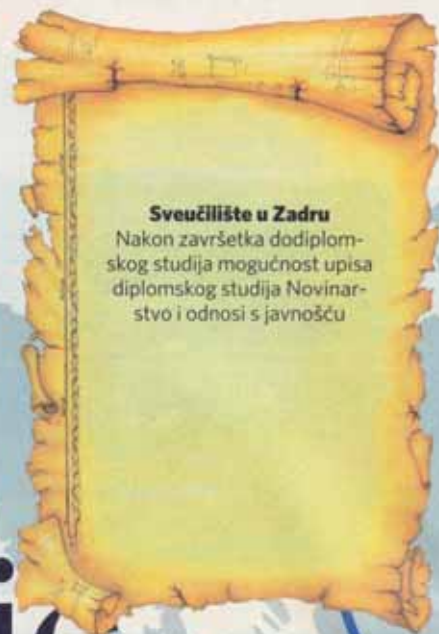
Sveučilište u Zadru Nakon završetka dodiplomskog studija mogućnost upisa diplomskog studija Novinarstvo i odnosi s javnošću